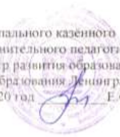
График групповых консультаций с учителями предметниками на 2020-2021 учебный год